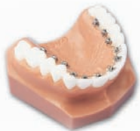
Lingual, also an den Innenseiten der Zähne geklebte Brackets.

Fragen Sie uns – wir beraten Sie gerne und schnüren mit Ihnen zusammen Ihr individuelles Leistungspaket. Verstecken Sie Ihre Behandlung, aber bloß nicht Ihr Lächeln!